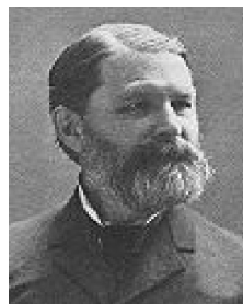
Robert Lowry, 1826-1899