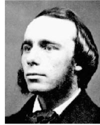
Washington Gladden, 1836-1918

葛萊敦認為宗教是神與人，和人與人之間的友誼。基督徒美好的生活不是與人隔離，乃是和他們打成一片，以服事人的行為，引人歸主。他同情工人，曾二次參加罷工活動，一度被捕入獄。他不僅傳講《聖經》真理；在非崇拜時間，他也專題演講勞資問題，因此引起商界及政界的反對；他們認為「牧師的職責是救人靈魂，而不是干涉企業管理」。他感到孤立無助，就寫了這首詩，表達他的願望。本詩寫於1879年。並首次發表於 Sunday Afternoon 中。