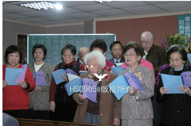
▲2005年1月1日敬老會獻詩

媽媽的歌聲中表達出她是那麼的敬虔與愛主，因為她是盡性、盡意、盡力用歌聲在讚美主、服事主，對我而言，她的歌聲是動人心弦的。