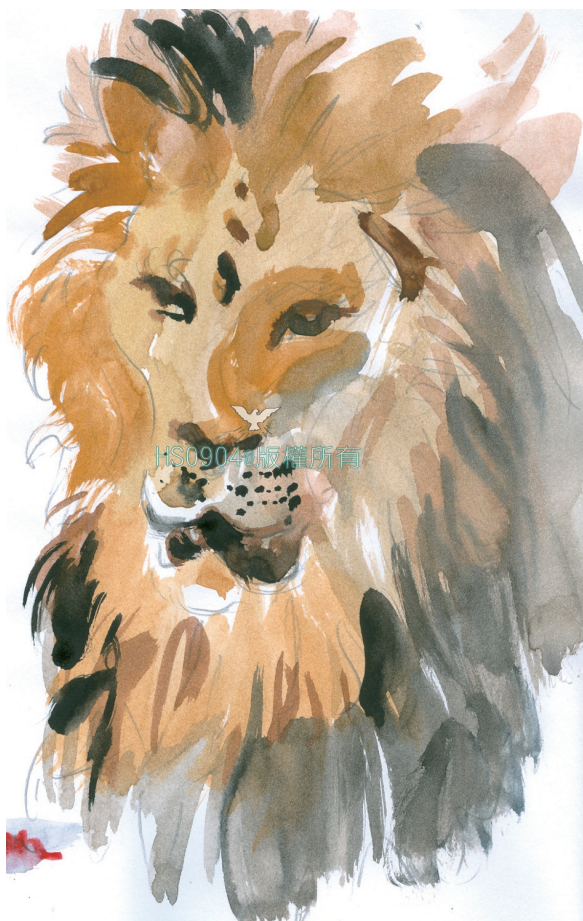
▲魔鬼有時露出猙獰的臉孔，如吼叫的獅子讓人害怕。

神是靈，拜祂需用心靈和誠實；面對神，不只是禱告而已，需要在平時的生活中配合。在此簡單歸納兩種態度，做為我們彼此的勉勵：