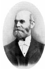
William J. Kirkpatrick, 1838-1921