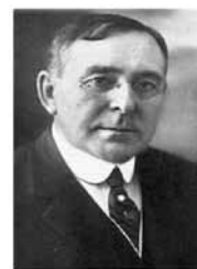
John Wilbur Chapman, 1859-1918

1. 神道成肉身，藉著童女降生，受聖靈充滿，傳天國福音， One day when heaven was filled with His praises, One day when sin was as black as could be,