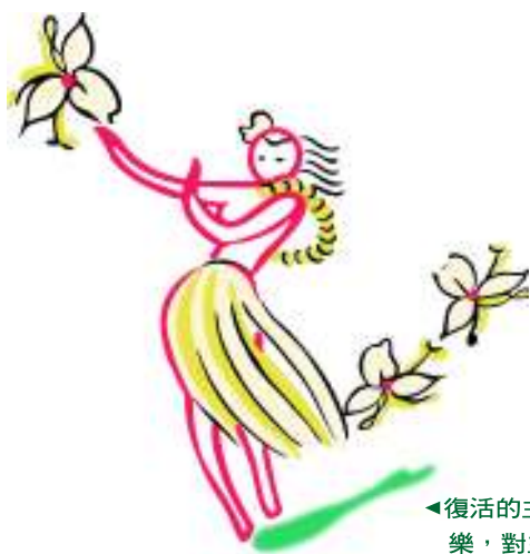
◀復活的主對馬利亞的顯現，使她的哀傷變成喜樂，對主的信心更獲得堅固。

《約翰福音》中的「神蹟」，希臘文為 σημεῖον，意思是「記號」；而耶穌復活的神蹟，要告訴我們什麼信息？耶穌對馬利亞說：「你往我弟兄那裡去，告訴他們說，我要升上去見我的父，也是你們的父，見我的神，也是你們的神。」（約二十 17），在耶穌復活以前，神是耶穌的父；當耶穌復活以後，神成為信徒的父。耶穌曾應許信徒要成為神的兒女（約一 12），這應許在祂復活後實現了。