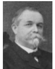
James McGranahan 1840-1907