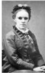
Fanny J. Crosby 1820-1915

I would have the Saviour with me, For I dare not walk alone;