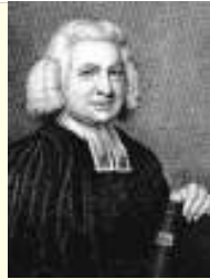
Charles Wesley 1707-1788

作 詞者查理·衛斯理 (Charles Wesley)，1707年12月8日生於英國，父親是一位傳道人，他在十九位弟兄中排行第十八（其中九人夭折）。查理從小就展露超人的智慧和才華，1726年進入牛津基督教會學院 (Oxford Christ Church College) 讀書，因優異的成績獲得每年一百鎊的獎學金。1729年畢業，仍留母校任導師。他和一群青年組織「牛津聖團」 (Holy Club) 每天定時讀經禱告，且一週兩次禁食禱告，嚴格自我省查、訓練自己，同時也做許多慈善、傳福音的工作。當時的同學替這個組織的人起了個綽號為「循理人」——即循規蹈矩之意，這便是循理會 (Methodist) 的起源。