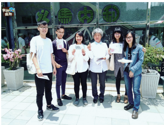
參加南門教會50週年感恩特別聚會