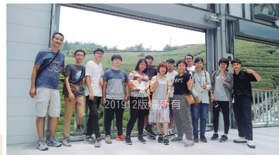
與迦南團契一起去阿里山送舊出遊