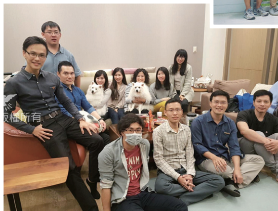
充滿愛與歡笑的歸仁社青