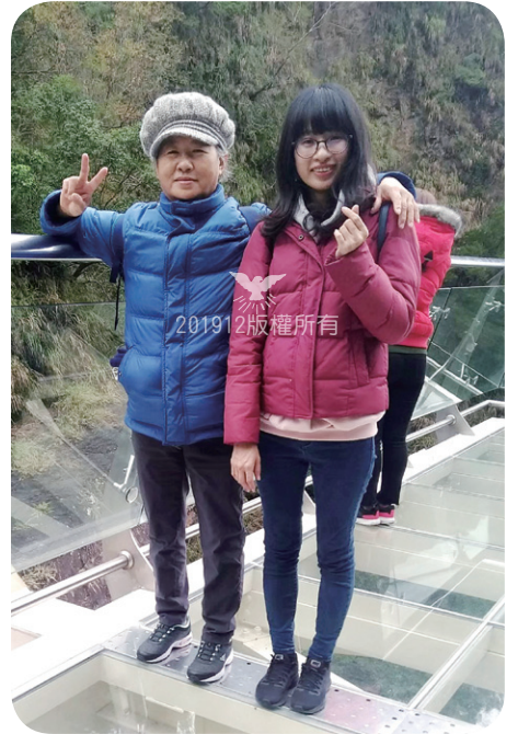
與媽媽參加2018年歸仁教會秋季出遊活動

2016年3月26日，是我受洗歸入主名下的日子。信主前的我，從未想過有一位真神這樣愛我，關心我的需求、扶持我的軟弱、預備我所需用的，並且不僅愛我也愛我的家人，揀選我也揀選我的家人。我明白靈魂能得救已是至大的福氣和恩典，但當爸爸癌末安息時，祂又帶給我們一家莫大的安慰與幫助。我所擔憂的、無力承擔的，祂都為我一肩擔下。我深知除了祂，再別無拯救。