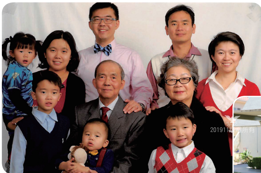
全家福，2019年6月加添新成員，共11人，感謝神！