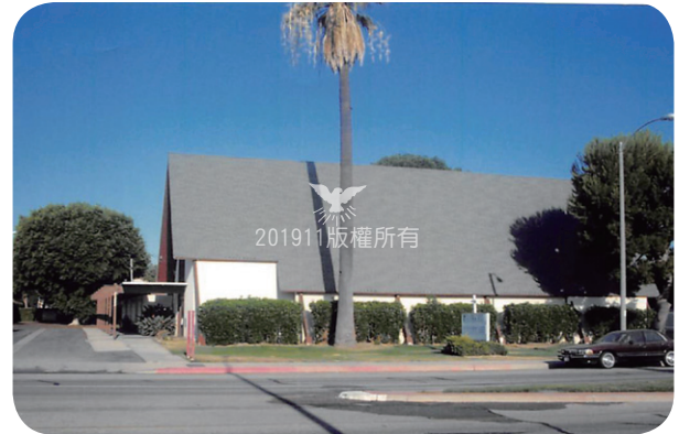
承租期間，會堂外觀。