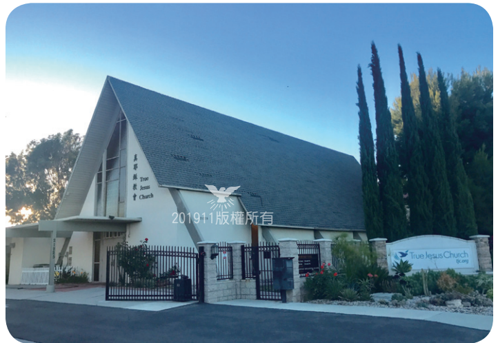
購買整修後，會堂的外觀。