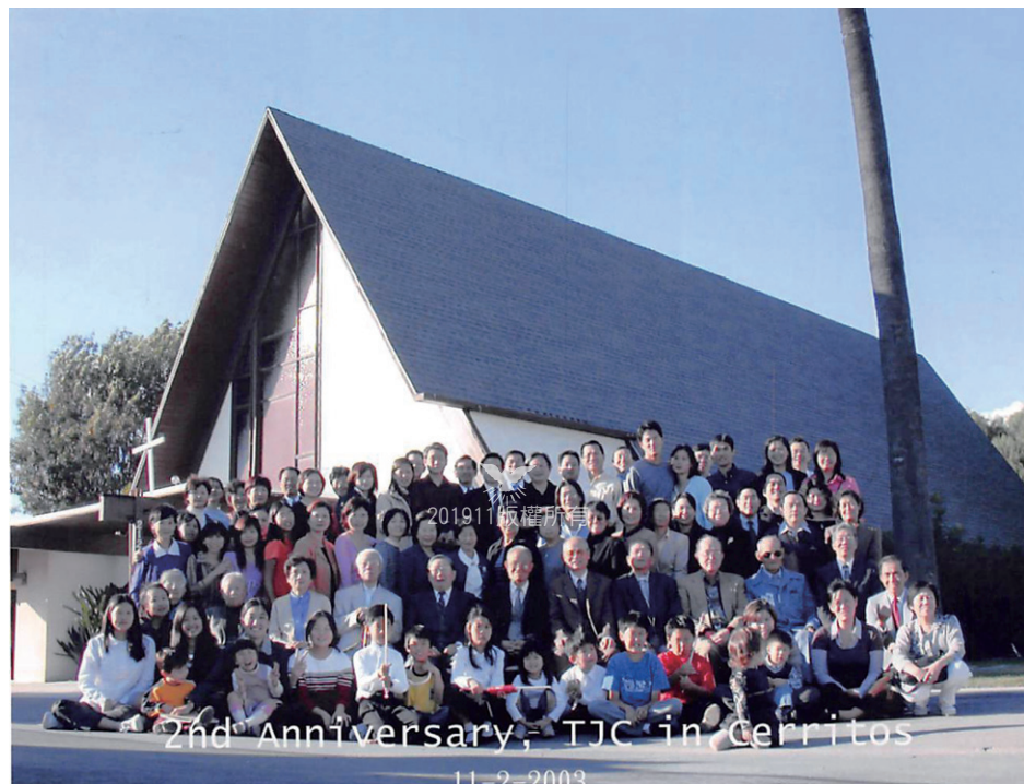
喜瑞都祈禱所第一次全體同靈合照於2003年11月2日。

為了辦理教會的宗教教育，當時曾經想請求園林教會協助，分派教員來喜瑞都上課，但園林教會並無多餘的人力能幫忙，於是職務會決定自辦宗教教育，初步將所有學生簡化成大、中、小三班。為了彌補資源的缺乏，既然合格的教員不夠，就遴選適當的信徒來協助；教室不夠，就將走廊和庭院的