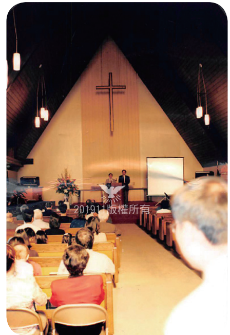
會堂內部，2001年3月祈禱所成立感恩特別聚會，職務會報告祈禱所籌備經過。