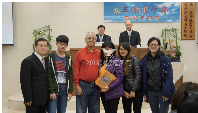
與姐姐參加教會活動，訪問大灣教會。

原本三七的法會我不想到場，但經過禱告後，感覺還是應該要到場陪婆婆、照看小孩，不能因害怕就逃避，要靠主勇敢面對，相信主必會看顧、保守我。