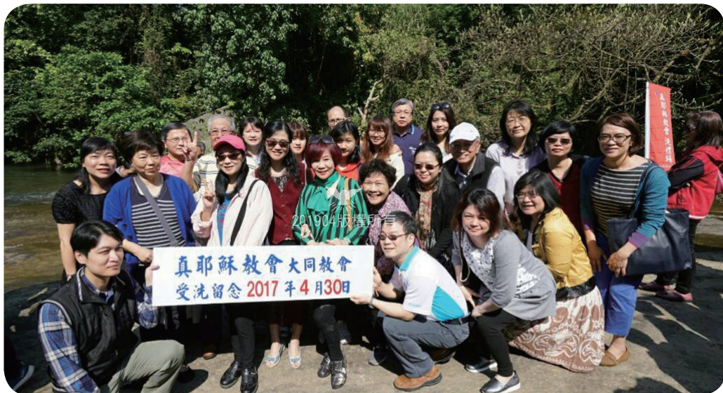
受洗當天教會拍的紀念照，父親、先生、小孩、姐姐、老師、同學都一起來觀禮，見證神的恩典。