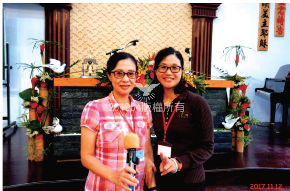
姐姐受洗那日，在教會一起拍紀念照。