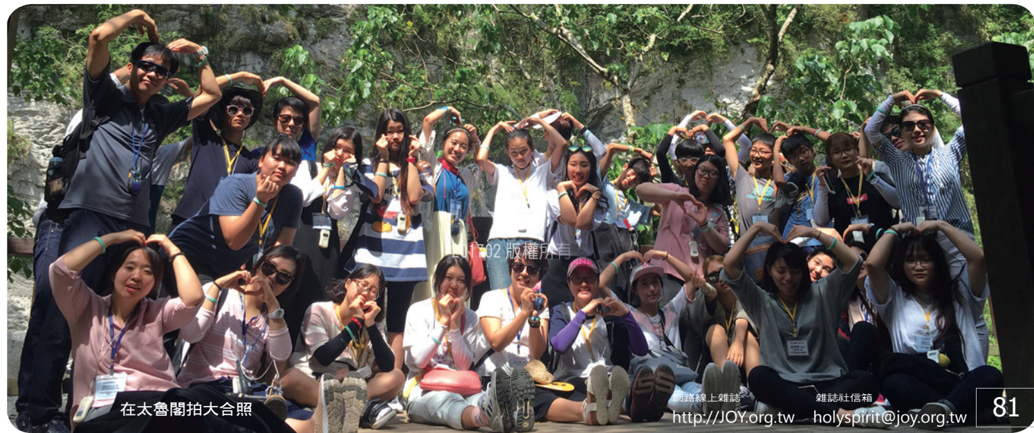
在太魯閣拍大合照