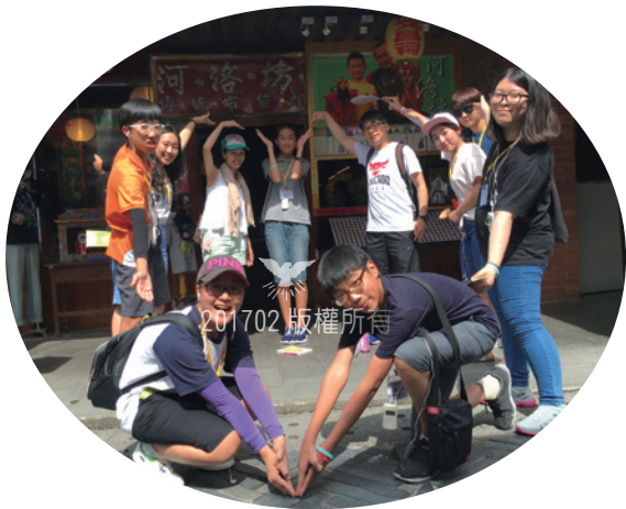
在宜蘭民藝街跟旅客一起造愛心

這次第七次學生部訪問團團員，各自都有很多情由，在這些諸多情由的抉擇下，最後共有二十三名學生和九名教師參加。為了此次行程，台灣也有三名教師前來支援。選擇「學生部訪問團」的弟兄姊妹們，都是把神的事情放在了第一位，並因著追求「人才養育、靈性交流、信仰更臻成熟」的目的而被選上的信徒。他們所選的這個墊腳石，將會帶領他們的腳步前往神的國，並且把真耶穌教會所懷的指望傳承給下一代。