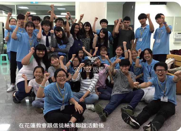
在花蓮教會跟信徒結束聯誼活動後

的情況下，還能與台灣弟兄姊妹互相成為一體的瞬間。首先，在用「哈利路亞」打招呼的時候開始，我們便感受到在主裡都是一家人的親切，當倚靠著同一個聖靈禱告的時候，更是體會到彼此是同受一個靈的弟兄姊妹們。尤其是詩歌聯誼時，更讓我們忘記了語言上的障礙，同心合意地崇拜神。表情、目光、信徒們的一舉一動，表現出了對神的盼望和對神恩典的感謝之心。