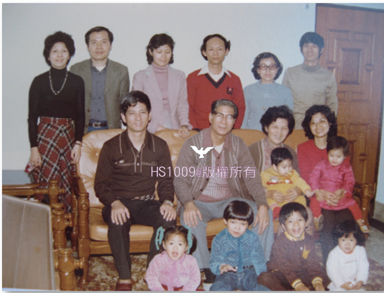
全家照片：照片攝於家父60歲生日(1980年，生病前夕)，最中間是雙親，雙親左右是末肢夫婦，後排左1、2 是大妹夫婦，其次是二妹、大弟夫婦。

得很重，又尚未接受真教會的洗禮，所以就幫助他祈禱。禱告完後，傳道問家父是否願意接受赦罪的洗禮，將來得天國的福氣？因為他看家父病得很嚴重，如果接受洗禮，起碼靈魂可以得救，肉體病痛或許也可減輕。想不到就這麼簡單一問，父親竟然回答：「我現在受洗還來得及嗎？」