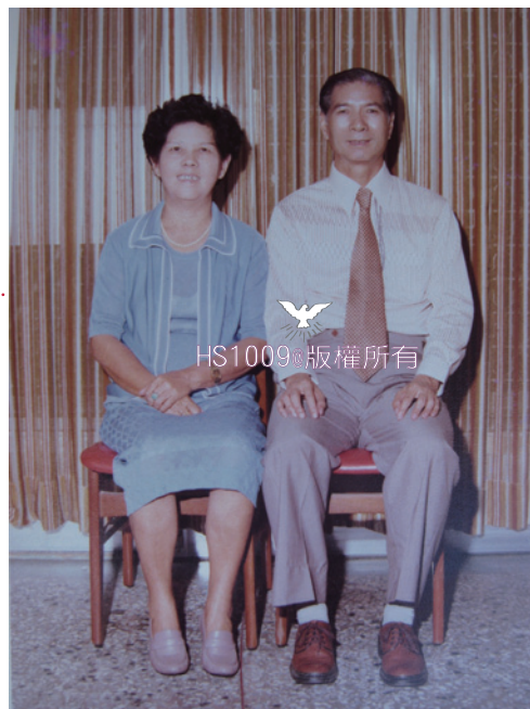
雙親照片：攝於家父60歲生日。

人的盡頭是神的起頭，三年多全家努力的禱告好像沒有什麼功效，但其實神早已計畫好了。